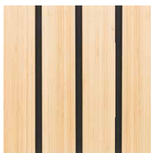
Bambus Sidepressed Nature